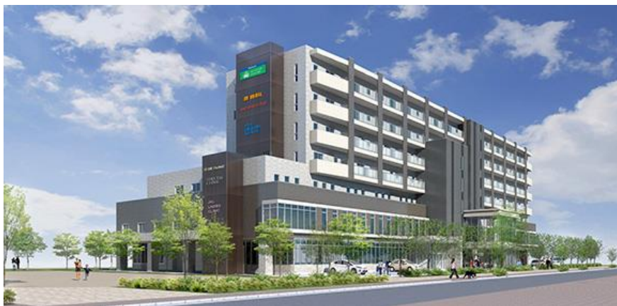
完成予想イメージとなります。

また、運営面においては、テナントリレーションを強化することで、本施設のコンセプトに沿って、テナント間や本施設内での連携、さらに地域や健都内各事業者との連携を図り、多世代交流と生涯学習・生涯活躍をテーマとした『健都版CCRC』の実践を目指して参ります。